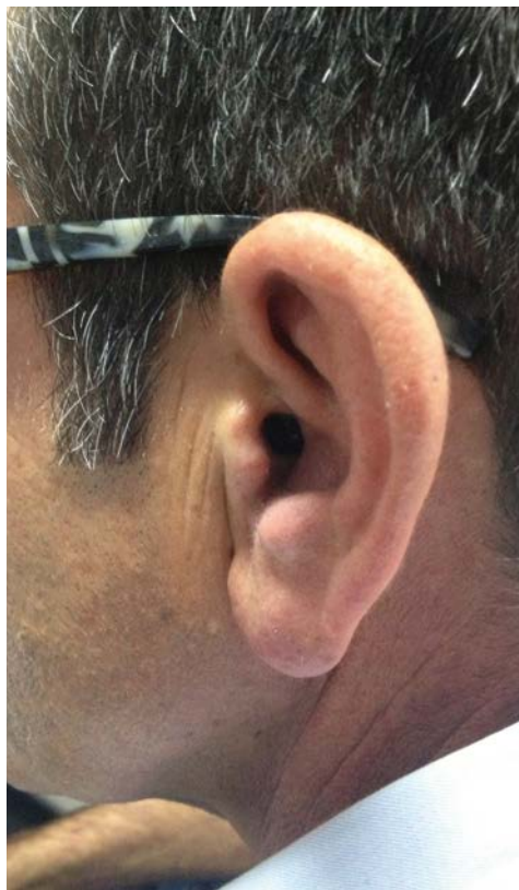
Immagine di un paziente protesizzato

La carenza di udito, conosciuta come ipoacusia, provoca un abbassamento della soglia uditiva liminare rendendo tutti o alcuni suoni non più percepibili dall'individuo che presenta tale deficit. Come risulta ben chiaro dall'esperienza quotidiana, soprattutto i soggetti in età avanzata subiscono un abbassamento della soglia uditiva (presbiacusia), provocando notevoli difficoltà nella comprensione del parlato sia in situazioni di ascolto di quiete che di rumore. In particolar modo, la tipica lamentela "SENTO LE PAROLE, MA NON LE CAPISCO"